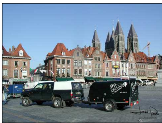
Le retrouvant sur la place de Mons