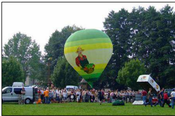
Minis ballons devant un large public pendant les préparatifs des gros ballons. à gauche : Meeting de Hazebroek (France) à droite : Meeting de Hotton (Belgique)