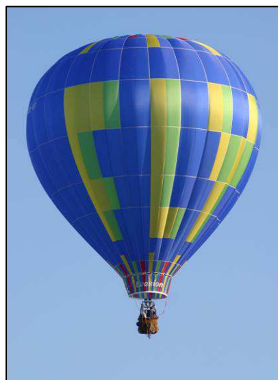
Notre ballon "Le Fly" de 3000m 3

Si vous le désirez, nous possédons quelques belles photos sur notre site Internet : www.flyevasion.org