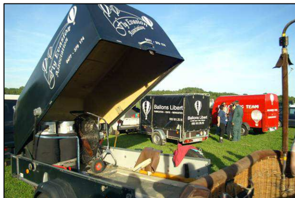
La voiture et la remorque sont aussi des supports très visuels qui traversent sans cesse les régions où navigue la montgolfière.