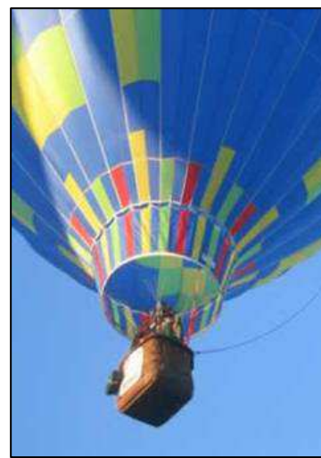
Vue sur les différentes parties du ballon qui peuvent accueillir votre logo. De gauche à droite : l'enveloppe du ballon neuf ou d'occasion ; la jupe du ballon ; panneau sur la nacelle